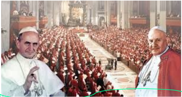
Una bella immagine del Concilio Vaticano II iniziato l'11.10.1962 con Giovanni XXIII e completato l'8.12.1965 con Paolo VI

Più DIOCESI formano una Provincia Ecclesiastica. Le varie Province Ecclesiastiche formano delle Regioni Ecclesiastiche. L'Italia ha 16 Regioni ecclesiastiche (più l'Ordinariato Militare) che comprendono complessivamente 224 Diocesi. La Puglia comprende 4 Province ecclesiastiche (Bari-Bitonto; Lecce, Taranto, Foggia) con 19 diocesi complessivamente.